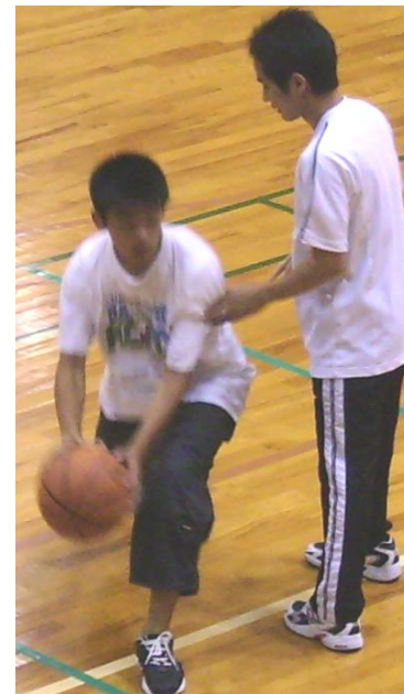
バスケット指導風景