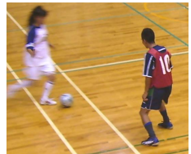
フットサル練習風景(男女混合)